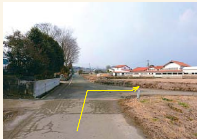
E T字路を右に曲がったあとすぐ左に入る Turn right at the T-junction then immediately take a left.