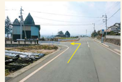
N T字路を左に曲がる Turn left at the T-junction.