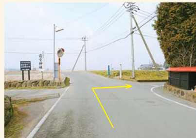
H カーブミラーを右に入る Take a right at the convex traffic mirror.