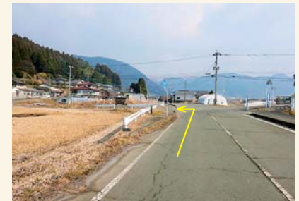
M 標識を左に曲がる Turn left at the road sign.