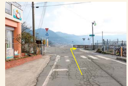
O 保育園前の交差点を右に曲がる Turn right at the intersection with a daycare center.