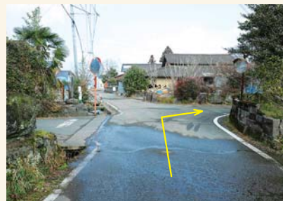
I カーブミラーを右に曲がる Turn right at the convex traffic mirror.