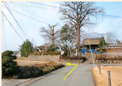
B つきあたりを左に曲がる Turn left at the end of the street.