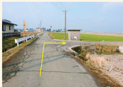
F T字路を右に曲がる Turn right at the T-junction.