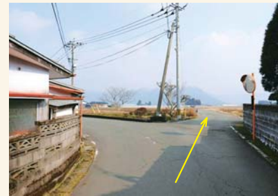
J 三叉路を右に入る Take a right at the 3-way junction.