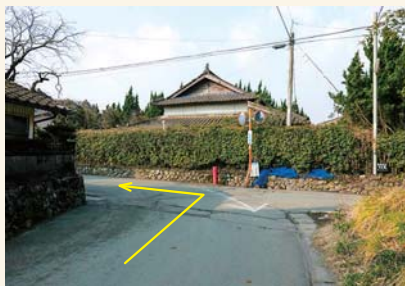
C つきあたりを左に曲がる Turn left at the end of the street.