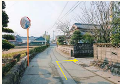
D カーブミラーを右に入る Take a right at the convex traffic mirror.