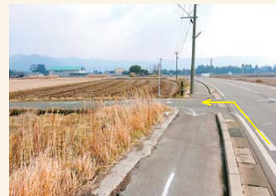
L 電柱を左に入る Take a left at the utility pole.