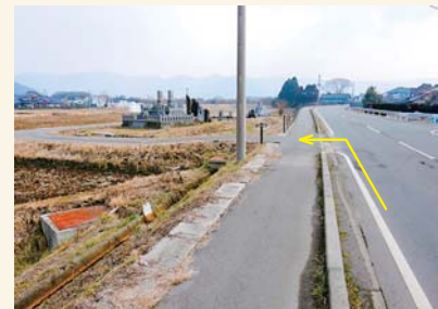
K 電柱を左に入る Take a left at the utility pole.