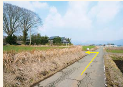
G カーブミラーを左に曲がる Turn left at the convex traffic mirror.